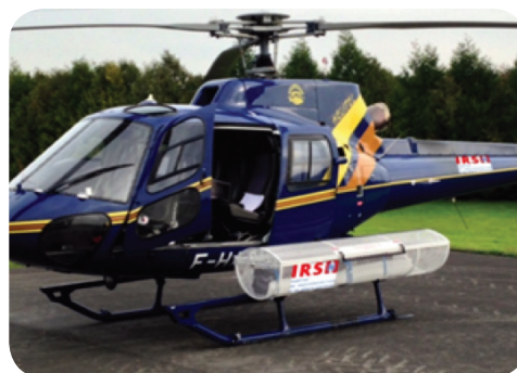
Appareil portatif de mesures.