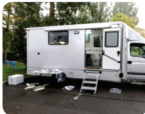
Véhicule laboratoire d'analyses.