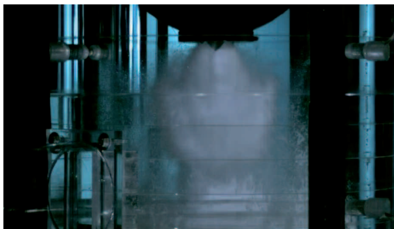
Expérience sur l'installation DISCO-C.

■ Le phénomène d'échauffement direct de l'enceinte de confinement d'un réacteur à eau sous pression est envisagé dans les scénarios d'accident grave avec rupture du fond de cuve : le corium et les gaz chauds présents dans la cuve sous pression sont alors éjectés dans l'enceinte, conduisant à l'échauffement de son atmosphère et à sa mise en pression.