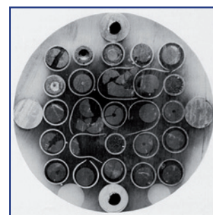
Essai Phébus LOCA

Le logiciel DRACCAR bénéficiera des apports scientifiques des programmes expérimentaux ELFE, COCAGNE, COAL réalisés dans le cadre du projet PERFROI (Programme Investissement d'Avenir).