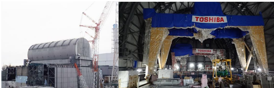
Vue de la structure recouvrant le bâtiment du réacteur 3 (état en février 2018) et des moyens de manutention du combustible qui y sont implantés

La reprise du combustible dans la piscine du réacteur 3 est prévue en 2018. TEPCO a engagé la construction d'une structure recouvrant le bâtiment de ce réacteur. Le retrait des principaux débris du plancher supérieur du bâtiment (5 ème niveau 4 ) et de la piscine est terminé. En novembre 2017, TEPCO a engagé le montage des dispositifs de manutention nécessaires au déchargement de la piscine. Fin février 2018, la pose de la structure est achevée.