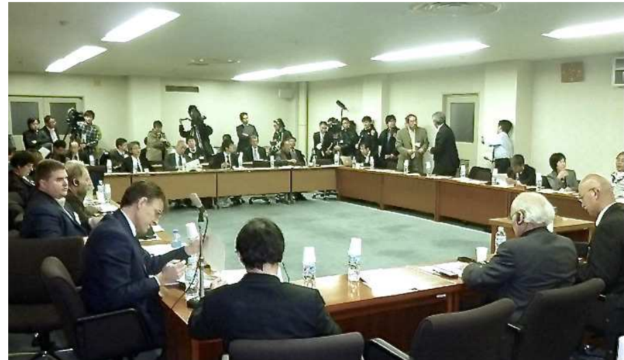
Première réunion de l'Initiative de Dialogue de la CIPR à Fukushima en novembre 2011