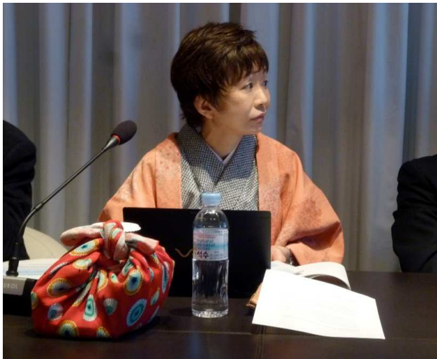
Témoignages lors de la réunion de la Commission principale à Séoul en avril