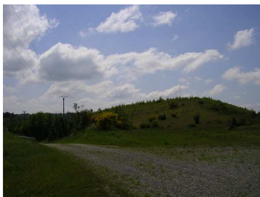
Verse à stériles

Pour l'essentiel, les stériles sont restés sur leurs sites de production (figure 2). Ils y ont été placés en tas (également appelés « verses ») ou utilisés pour combler les mines à ciel ouvert et effectuer des travaux de réaménagement (couverture des stockages de résidus de traitement en particulier).