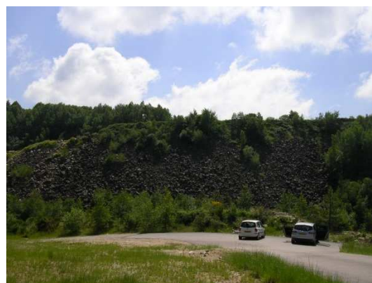
Stériles en talus