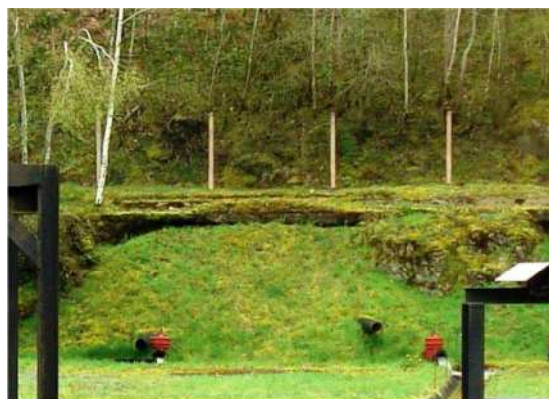
Figure 4 - Une des entrées de l'ancienne mine souterraine de Bellezane

Après exploitation, l'ensemble des sites a été réaménagé de manière à les mettre en sécurité, à réduire leur impact radiologique et à effectuer leur intégration paysagère. Les travaux miniers souterrains ont été partiellement remblayés puis noyés. Les accès aux galeries ont été condamnés (figure 4), les puits scellés. Les mines à ciel ouvert ont été soit noyées, créant ainsi des plans d'eau artificiels, soit remblayées avec des stériles ou encore utilisées comme site de stockage pour les résidus de traitement.