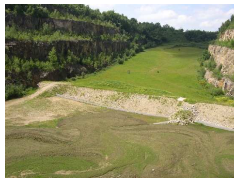
Stockage de résidus de Bellezane