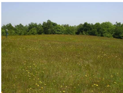
Stockage de résidus de Montmassacrot

Les stockages de résidus ont été réaménagés, clôturés et font actuellement l'objet d'une surveillance par AREVA sous le contrôle de la DRIRE. Les réaménagements ont notamment conduit à la mise en place, au-dessus des résidus, d'une couverture constituée d'une couche de stériles de quelques mètres d'épaisseur et d'une couche de terre végétale 3 (figure 3). Cette couverture a principalement pour objectif d'empêcher tout contact direct avec les résidus, de constituer un écran radiologique et de limiter les quantités de radon 4 dans l'air.