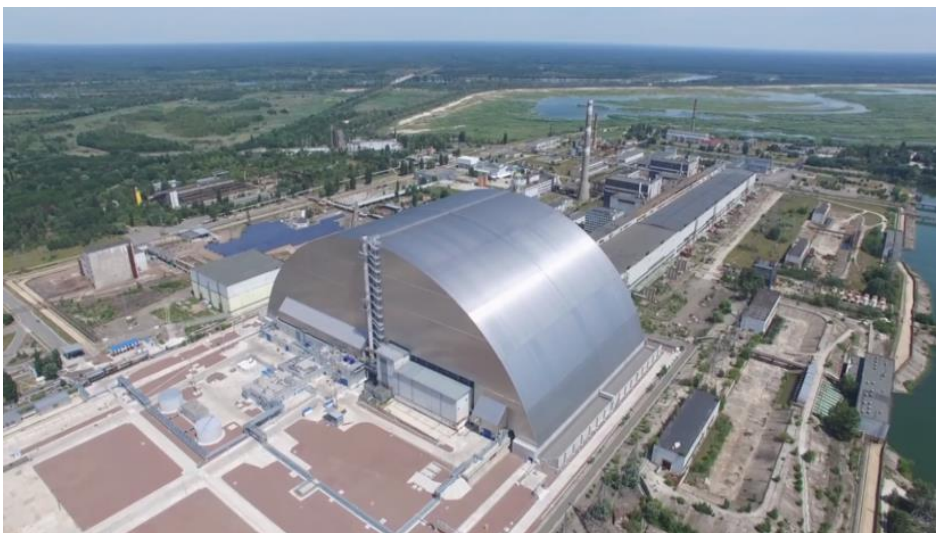
L'arche de confinement du réacteur accidenté n°4 de la centrale de Tchernobyl

Le réacteur n°4 a été confiné en urgence dans un sarcophage (Object Shelter : OS) provisoire. Les incertitudes sur la tenue structurelle de ce sarcophage au-delà d'une durée d'environ 40 ans a conduit l'exploitant de la centrale de Tchernobyl, avec l'aide financière et technique de la communauté internationale, à construire une arche de confinement (New Safe Confinement : NSC) afin de protéger l'environnement et de permettre le démantèlement du sarcophage. Construite sur une aire extérieure à distance du réacteur, les travaux de construction de l'arche ont débuté en 2008 et se sont achevés en 2017 avec la mise place de l'Arche.