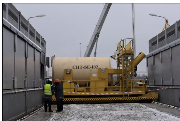
The first case with spent nuclear fuel is placed in the storage of spent nuclear fuel «dry» type – ISF-2 3

L'ISF-2 a été conçue pour une durée de 100 ans et se compose de 2 parties ; une installation pour le conditionnement des assemblages combustibles usés et une zone d'entreposage constituée de modules d'entreposage horizontaux en béton. L'installation est conçue pour assurer le conditionnement de 2 500 assemblages combustibles par an. Le 18 novembre 2020, lors des essais « en actif » de l'installation ISF-2, le premier colis chargé d'assemblages combustibles usés a été inséré dans un des modules en béton de la zone d'entreposage de l'installation. Le 14 décembre 2020, la phase active des essais à chaud s'est achevée. L'autorisation d'exploiter l'ISF-2 devrait être délivrée par l'Autorité de Sûreté Ukrainienne en avril 2021.