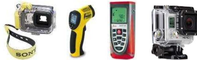
Appareil photo, caméra thermique, télémètre, moyen de visualisation à distance

■ Acheminement - véhicule dédié à l'ECC pour le transport du matériel sur zone (à disposition sur les sites de FAR, Agen et Les Angles)