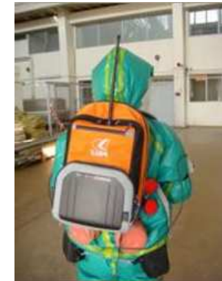
Équipement de communication par liaison radio

■ Moyens de télécommunication autonomes par satellite pour assurer la remontée d'information au CTC