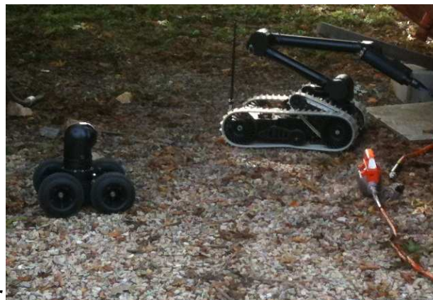
Base Mobile + Bras Manipulateur

autonomie 2h30 franchissement 15 cm vitesse max 5 km/h Caméra couleurs nuit/jour